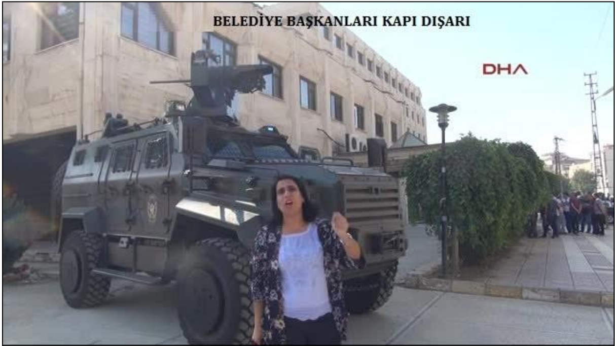
Fotoğraf: Batman Belediyesi'ne kayyum atandıktan sonra belediye binasının zırhlı araçlarla kuşatılması.

--Cizre Belediyesi Kadın Politikaları Müdürlüğü'ne bağlı Sitiya Zîn Kadın Danışmanlık Merkezi kapatıldı, merkezde bulunan kadın arşivlerine el konuldu. Gizlilik ilkesi çerçevesinde oluşturulan kurum arşivinde başvuru yapan kadınlara ait özel bilgiler bulunmaktaydı. Bu bilgilerin korunamaması halinde kadınların yaşamlarının tehlikeye girmesi ve kadına yönelik diğer şiddet türlerinin de artma riski söz konusudur. Bu durum Türkiye'nin imzaladığı uluslararası sözleşmelere de aykırılık teşkil etmektedir.