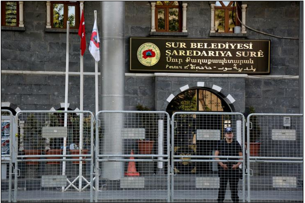
Fotoğraf: Sur Belediyesi'ne kayyum atandıktan sonra belediye binasının polislerce ablukaya alınması.

15 Temmuz 2016 tarihinde gerçekleştirilen darbe girişimi sonrasında ilan edilen OHAL (Olağanüstü Hal) kapsamında başta bölgemizde olmak üzere tüm ülkede birçok hukuksuz uygulama yaşama geçirilmiştir. 11 Eylül 2016 ve sonrasında 44 DBP'li belediyeye kayyum atandı. Atamaların yapıldığı gün atama yapılan kentlerde internet erişimi durdurulmuştur. Belediyelerin hiçbirine yapılacak atamalara ilişkin herhangi bir ön bildirimde bulunulmadan kayyumlar sabah saat 07.00 sularında belediye binalarına özel hareket polisleri ile birlikte gelmiş, belediye binaları askeri zırhlı araçlarla ablukaya alınmış, uygulamaya itiraz eden belediye eş başkanları, meclis üyeleri ve çalışanları zorla dışarıya çıkarılmıştır. Belediye binaları önüne gelerek kayyum atamalarına tepkilerini göstermek isteyen halka sert müdahalelerde bulunulmuş, gözaltına alınmışlardır. Atanan kayyumların ilk icraatları ise çok dilli olan belediye tabelalarını indirmek olmuştur.