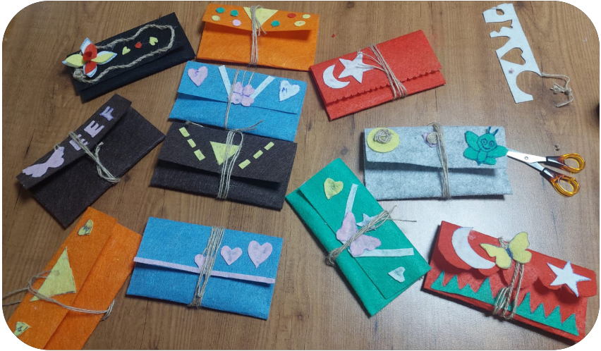
Malatya Akçadağ Kadın Kooperatifi Grup Çalışması Etkinliği

Yürüttüğümüz görüşmelerde, güvenli alan oluşturmak, ekonomik ve psikososyal güçlenme, erkek şiddeti gibi konuları ele aldık ve aynı-nakdi destek ihtiyaçları için yönlendirme yaptık.