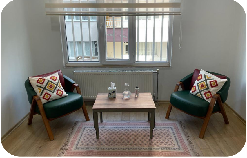
Diyarbakır DOGÜNKAD Ofis - PSD Odası

Programın yürütüleceği Adıyaman, Diyarbakır ve Malatya illeri için saha koşulları ve sahadaki ihtiyaçları gözeterek ayrı stratejiler belirledik. Diyarbakır'da PSD çalışmasının yapılması için bizimle dayanışma göstererek ofislerini açan Doğu ve Güneydoğu İş Kadınları Derneği'nin (DOGÜNKAD) mekanının bir odasını bireysel terapi için uygun hale getirdik. Gerçekleştirdiğimiz ziyaret ve toplantılarda, Diyarbakır'da faaliyet gösteren kadın ve LGBTİ+ örgütlerine yürüteceğimiz çalışmayı anlattık ve ihtiyaç sahibi kadın ve LGBTİ+'ları PSD hizmetlerimize yönlendirmeleri konusunda destek istedik. Diyarbakır'da sivil alanda yürütülen PSD çalışmalarının koordine edilmesini kolaylaştırmak ve yapılan çalışmalardan haberdar olmak amacıyla Diyarbakır'da PSD hizmeti veren STK'ları bir araya getiren Diyarbakır Ruh Sağlığı ve Psikososyal Destek-MHPSS grubuna dahil olarak toplantılarını takip ettik.