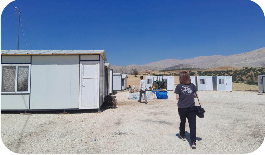
Adıyaman Yaylakonak Konteyner Kent

Adıyaman sahasının durumunu anlamak için ilk olarak sivil bir inisiyatif olan Adıyaman Sivil Toplum Kuruluşları Dayanışma Grubu'na katıldık ve üye STK'lardan sahada yürüttükleri destek faaliyetleri ve PSD'ye yönelik ihtiyacın olduğu yerler hakkında bilgi aldık. Elde ettiğimiz bilgiler ve gözlemler neticesinde STK'ların daha çok Adıyaman merkezde çalışma yürüttüklerini, merkeze uzak köylerde daha az destek faaliyeti yürütüldüğünü ve mevsim itibarıyla sıcakların artması ile barınma sorunu yaşayan birçok kişinin köylere geçtiğini tespit ettik. Bu nedenle Adıyaman'daki çalışmamızda köylere odaklanmaya karar verdik. 2 hafta boyunca Adıyaman'ın farklı ilçelerinde toplam 4 köy ve 2 beldeyi (Damdırmaz Köyü, Yaylakonak Beldesi, Bulam