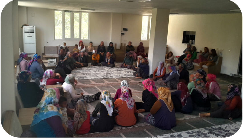
Adıyaman Tut İlçesi Akçatepe Köyü - Taziye Evi

Toplamda 1 ay boyunca ziyaret ettiğimiz beldede, 15 kadınla 2 haftalık grup çalışmasını okul binasında yürüttük. Kadınlar hane içi bakım işlerinin yanı sıra yoğun bir şekilde tütün hasadında çalıştıkları için grup çalışmasını hasat takvimlerine uygun olarak 2 haftayla sınırlandırdık ve ihtiyaç sahiplerine bireysel destek verdik. Geri kalan 2 hafta boyunca ev ziyaretleri gerçekleştirdik. Toplamda 40 kadına destek verdik; bunlar arasından 3 kadınla bireysel PSD görüşmesi, 1 kadınla ise bireysel terapi gerçekleştirdik. Doğum sonrası bebeğiyle ilgili ihtiyaçları olan 1 kadını başka bir kuruma yönlendirerek destek almasını sağladık.