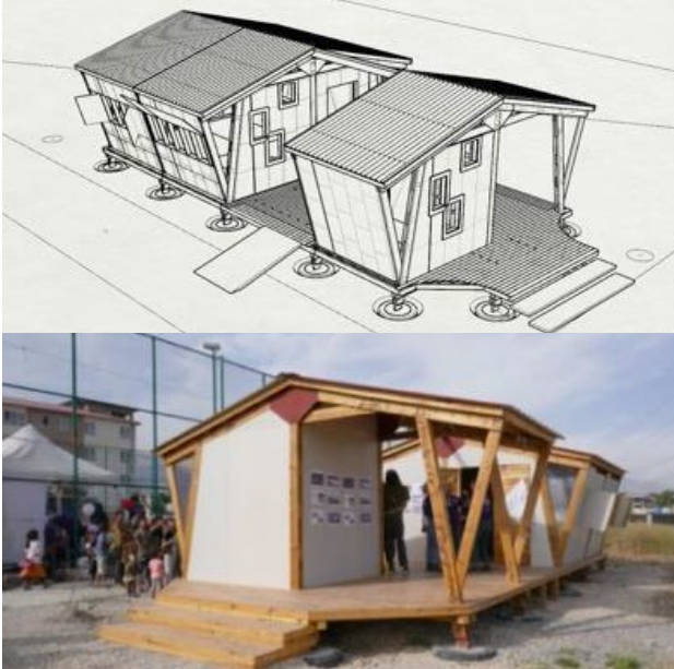
Görseller: Ahşap inşa tekniği (HiM, 2023)

Aldıkları fonla günlük bir "sofra" işlevi görecek ve çeşitli sosyal kullanımlara olanak sağlaması amaçlanan ahşap bir toplum merkezi inşa etmektedirler.