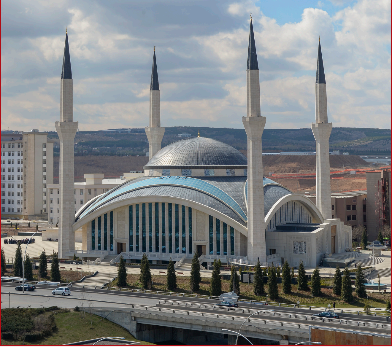
Ahmet Hamdi Akseki Camii