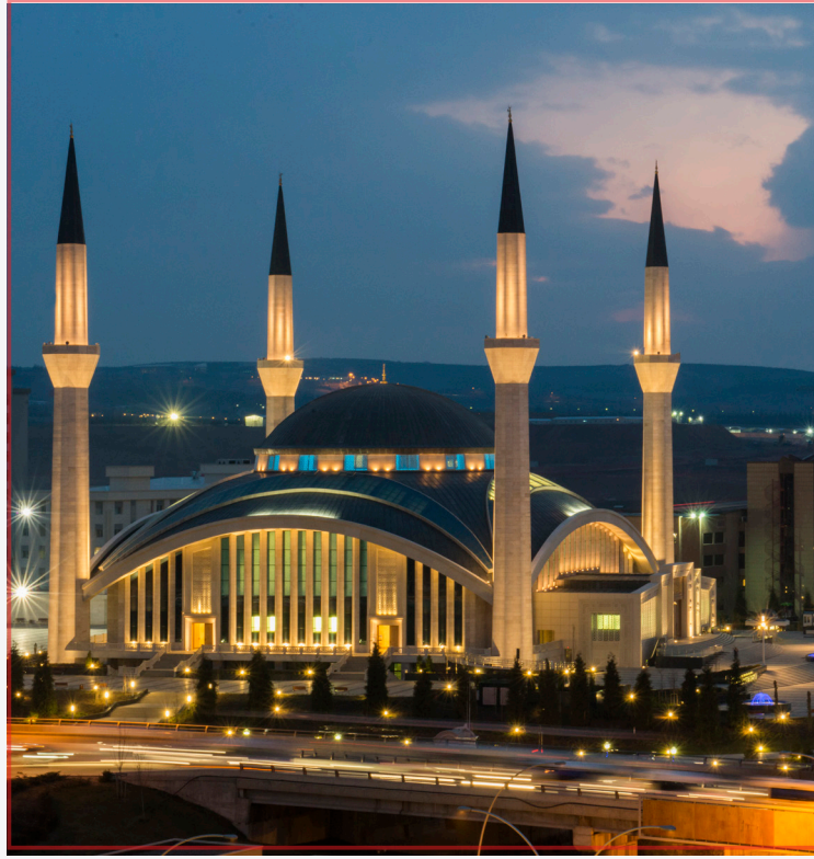
Ahmet Hamdi Akseki Camii