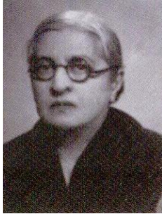
Halide Edip ADIVAR