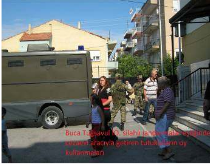
Oy verme yerinde propaganda materyali (İzmir)