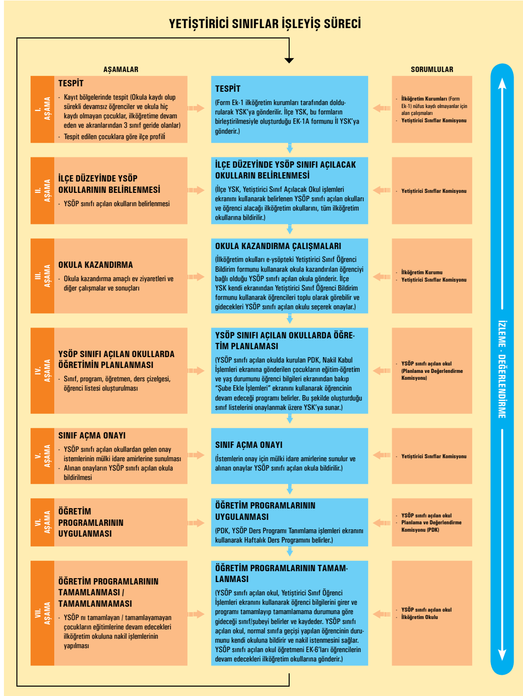
Tablo 4: Yetiştirici Sınıf Uygulamaları İşleyiş Süreci

Tablo 4'te yetiştirici sınıf uygulamaları kapsamında yapılacak çalışmalar aşamalar halinde gösterilmektedir.