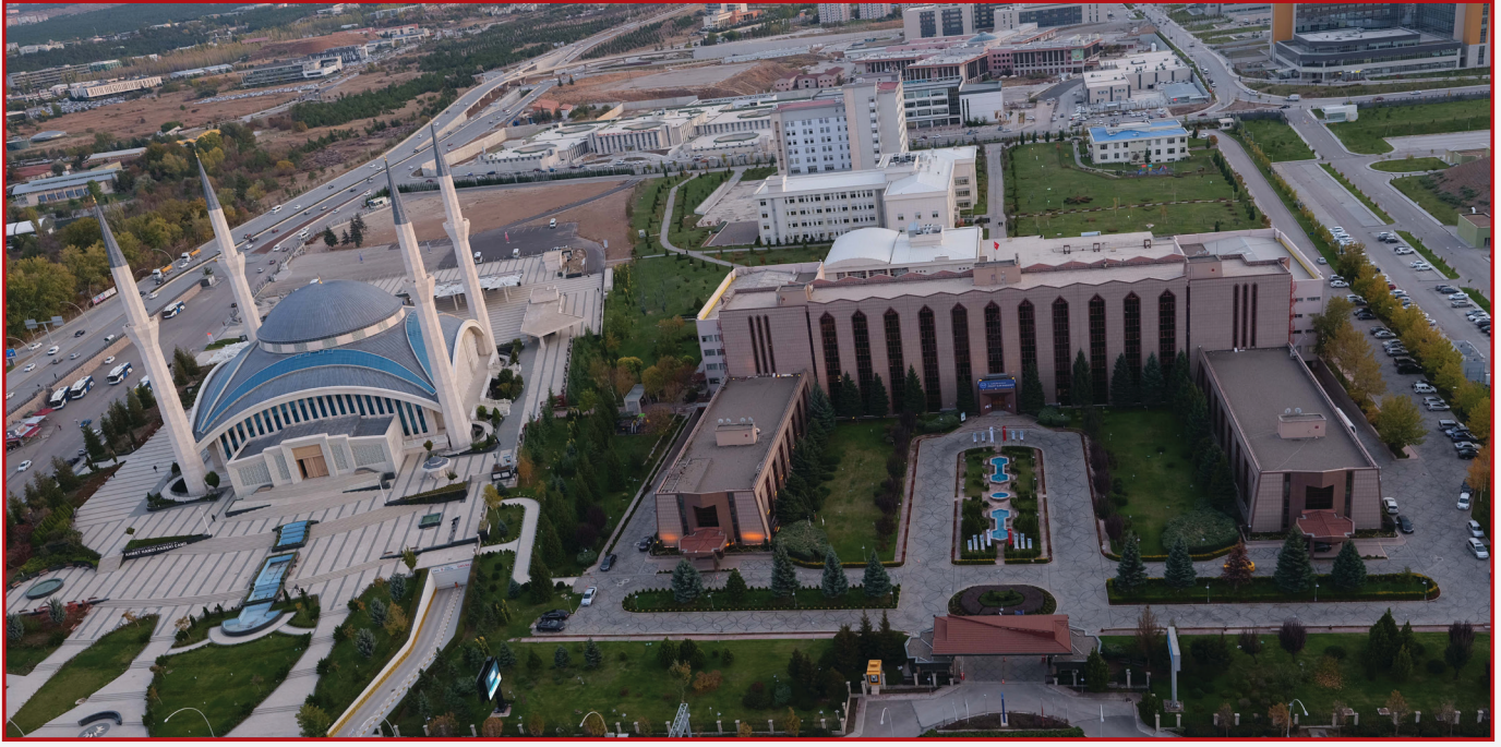
Başkanlık Merkez Binası ve Ahmet Hamdi Akseki Camii