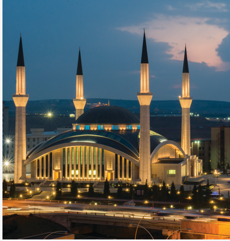
Ahmet Hamdi Akseki Camii