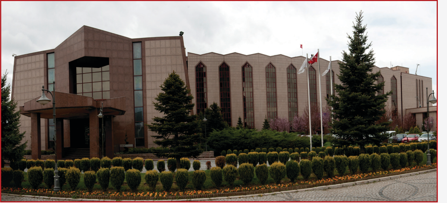
Başkanlık Merkez Binası