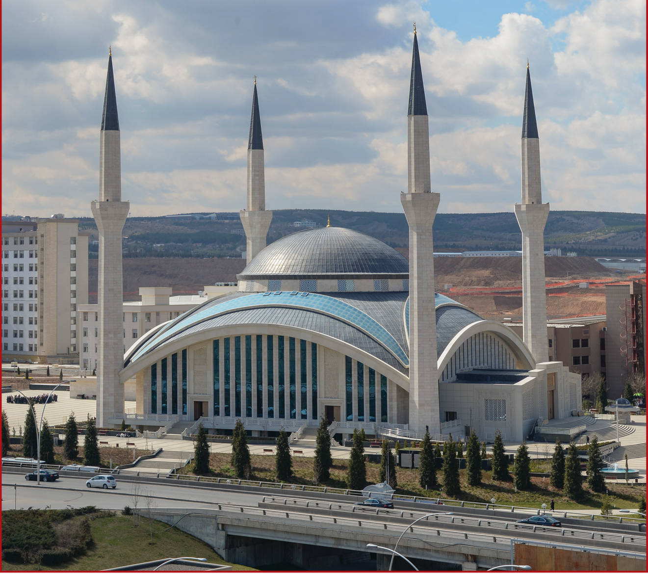
Ahmet Hamdi Akseki Camii