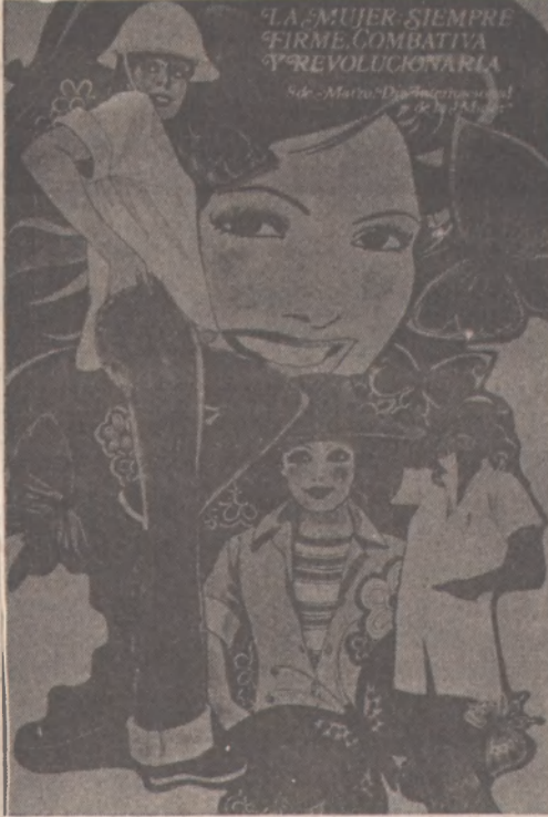
FMC posteri. Uluslararası Kadın Gunu 1977.

Çeviren R.Şen Süer. İstanbul Bibliotek Yayınları 1988. 143 s., 2000 TL.